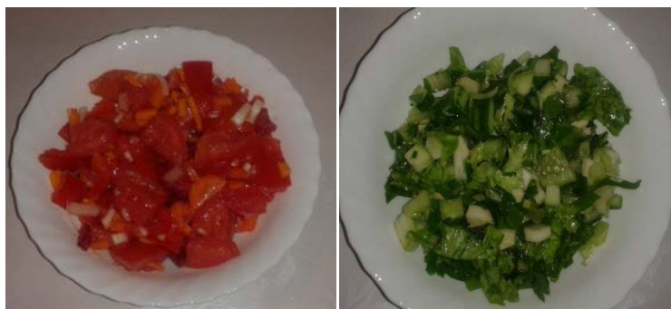
Pripremljene salate od povrća opranog u zeolitu.