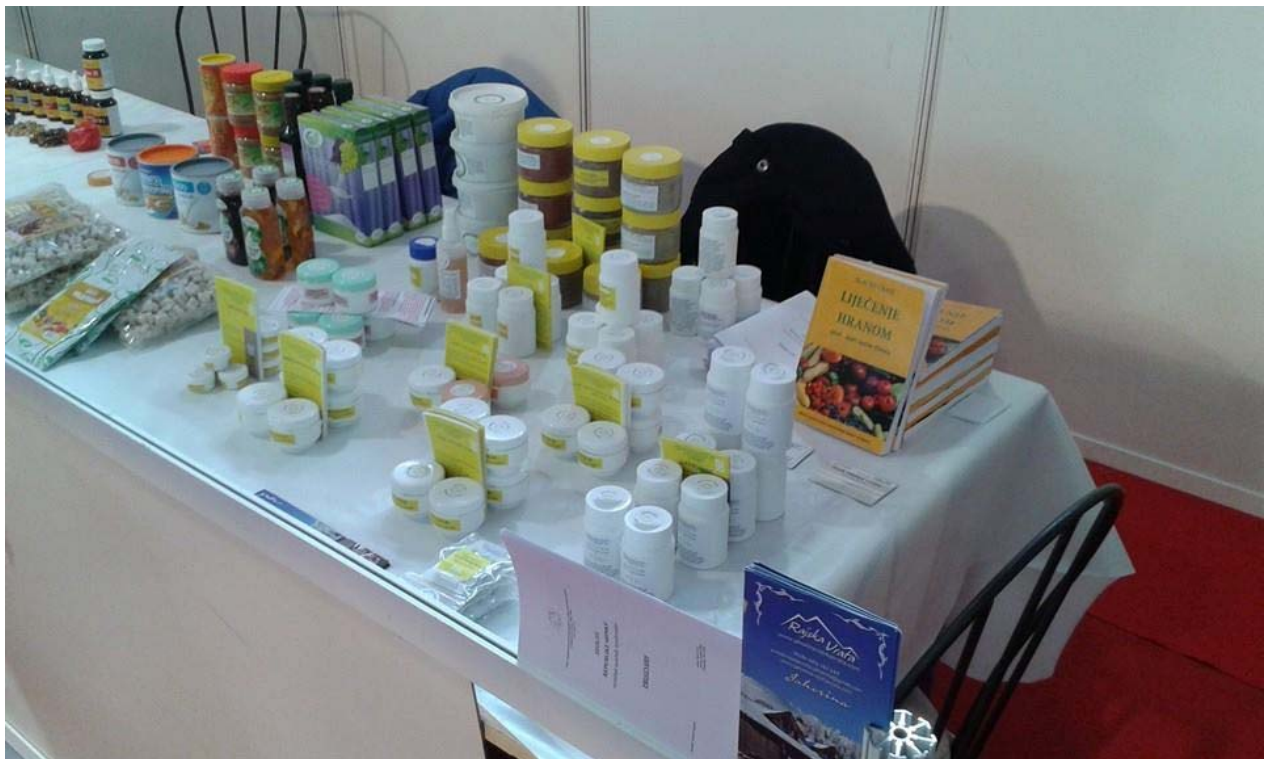
Proizvodi Instituta VINIS na sajmu.

ZA SVE INFORMACIJE KONTAKTIRAJTE NAŠ NA BROJ 065-495-228