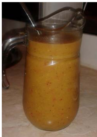
Sok od voća opranog u zeolitu.