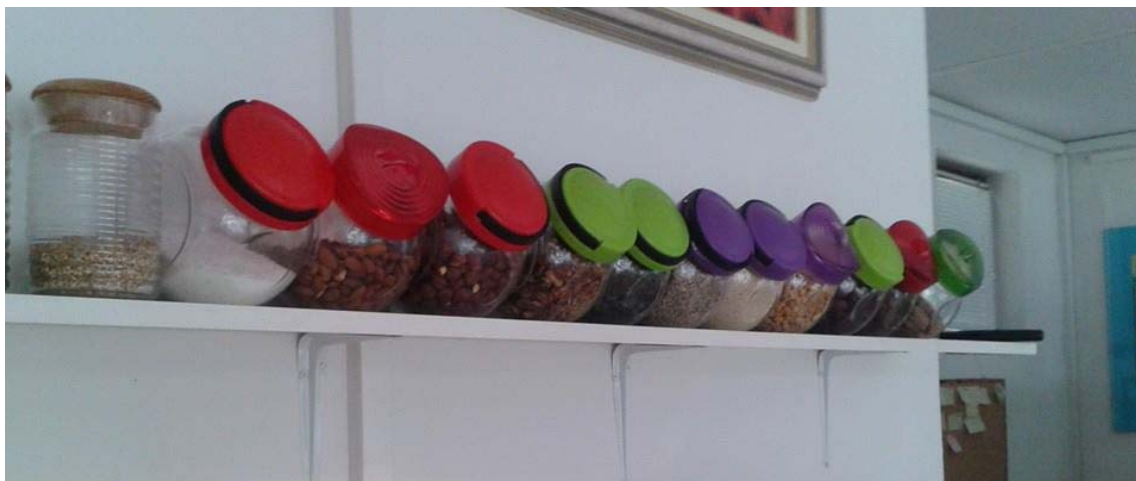
Skladište hrane u klubu „Hrana je lijek“