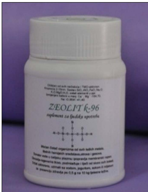
Aktivirani zeolit K-96